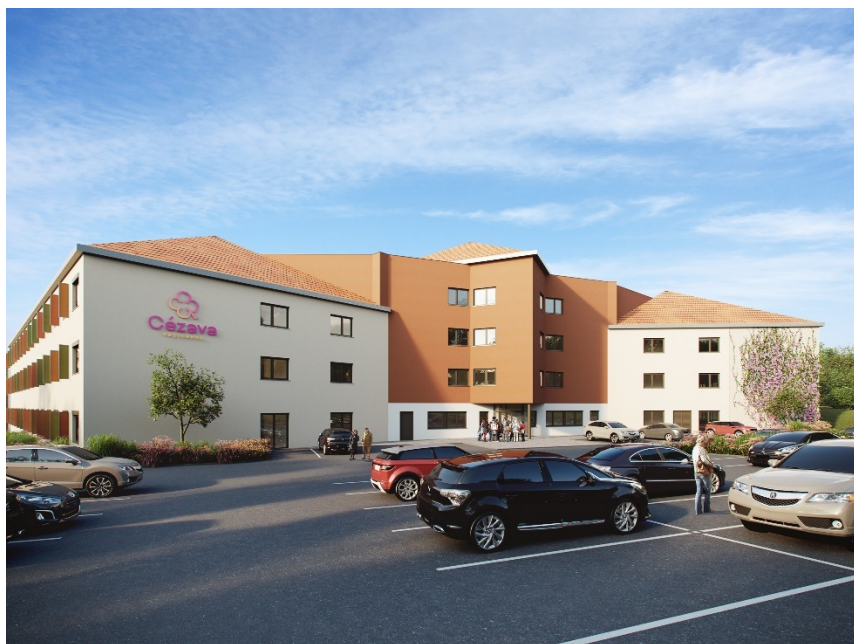
Obrázek 2 - Hlavní vstup do rezidence