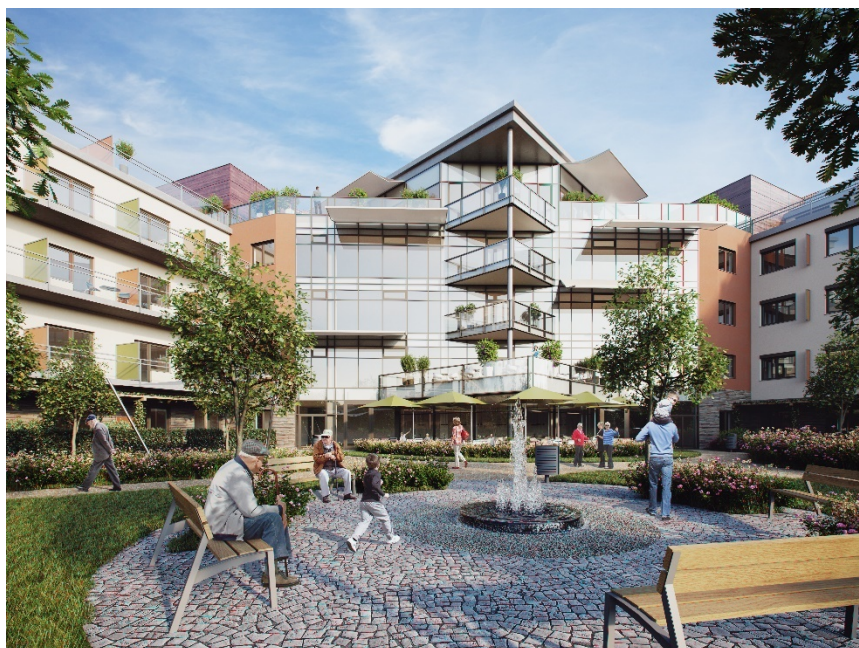
Obrázek 3 - Pohled z vnitřní zahrady