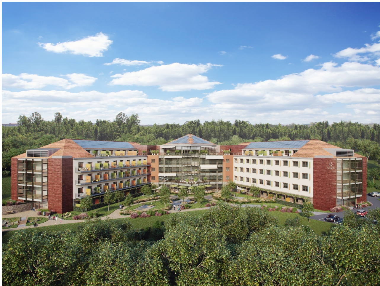
Obrázek 1 - Celkový pohled na rezidenci